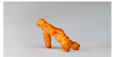
ブレイクダンサー