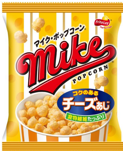
『マイクポップコーン チーズあじ』

また、「ポップコーン」には、食物繊維をはじめ抗酸化成分のポリフェノール、カリウム、鉄、亜鉛などが含まれ、とうもろこしの栄養素を皮ごとそのまま摂取できます。