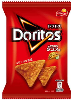
メキシカン・タコス味