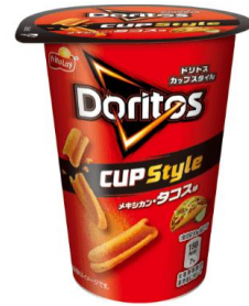
CUP Style メキシカン・タコス味