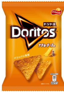
ナチョ・チーズ味