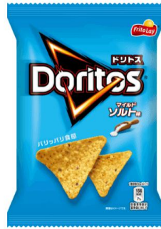
マイルドソルト味