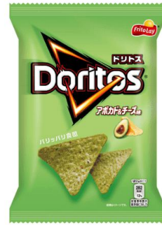
アボカド&チーズ味