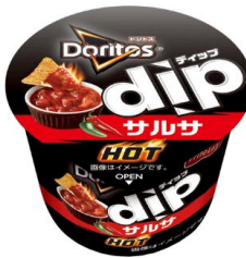
dip サルサ HOT