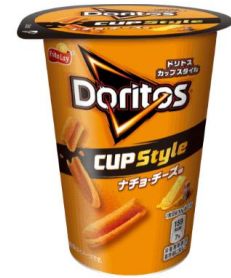
CUP Style ナチョ・チーズ味