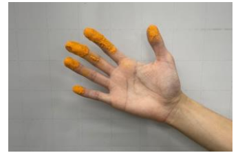
※画像は演出上のイメージです。

「チートスを食べた時に指につく粉」は、公式には「cheetle(チートル)」と呼ばれています。名前がよく似ているカナダ・アルバータ州チードルに粉のついた指をモチーフとした巨大オブジェが建てられたり、アメリカではオンライン辞典にも登録されるなど、世界中で愛されているトレードマークです。