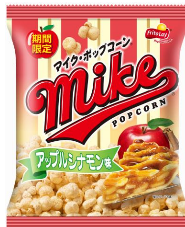
【マイクポップコーン アップルシナモン味】