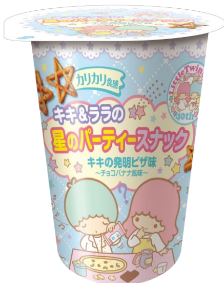
『キキ&ララの星のパーティースナック キキの発明ピザ味』

『キキ&ララの星のパーティースナック』は、「キキ&ララ」の誕生日12月24日に向けたクリスマス限定商品で、誕生40周年を記念して「キキ」と「ララ」によるユニークな味付けで発売。発明好きで食いしん坊の「キキ」とスープ作りが得意な「ララ」が、クリスマスパーティーのために思い思いの料理を作りました。