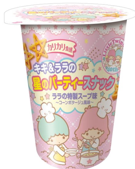
『キキ&ララの星のパーティースナック ララの特製スープ味』