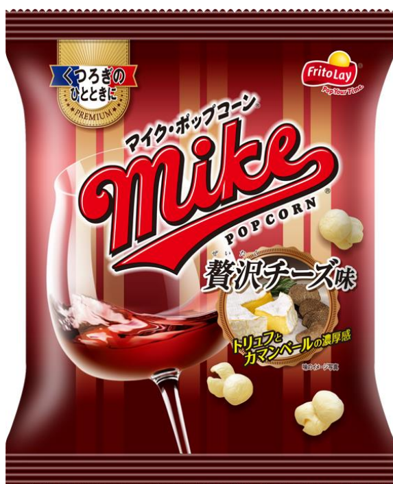
『マイクポップコーン 贅沢チーズ味』

また、チーズは、ワインに含まれるタンニンの渋みを和らげ、ワインの味をまろやかにするなどの効果があるとも言われ、チーズのタイプによっても相性の良いワインは様々です。