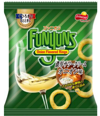
『ファニオン 濃厚サワークリームオニオン味』