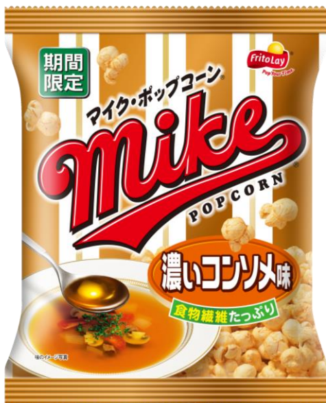
『マイクポップコーン 濃いコンソメ味』

さらに「ポップコーン」には、女性にうれしい食物繊維をはじめ抗酸化成分のポリフェノール、カリウム、鉄、亜鉛など、とうもろこしの栄養素を皮ごとそのまま摂取できます。